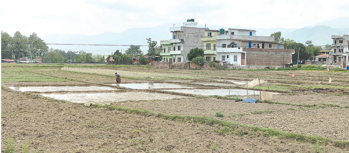
व्याडको तयारी : घोराही उपमहानगरपालिका वडा नं. १५ स्थित चन्द्रसूर्य टोलमा धानको व्याड राख्दै किसान ।