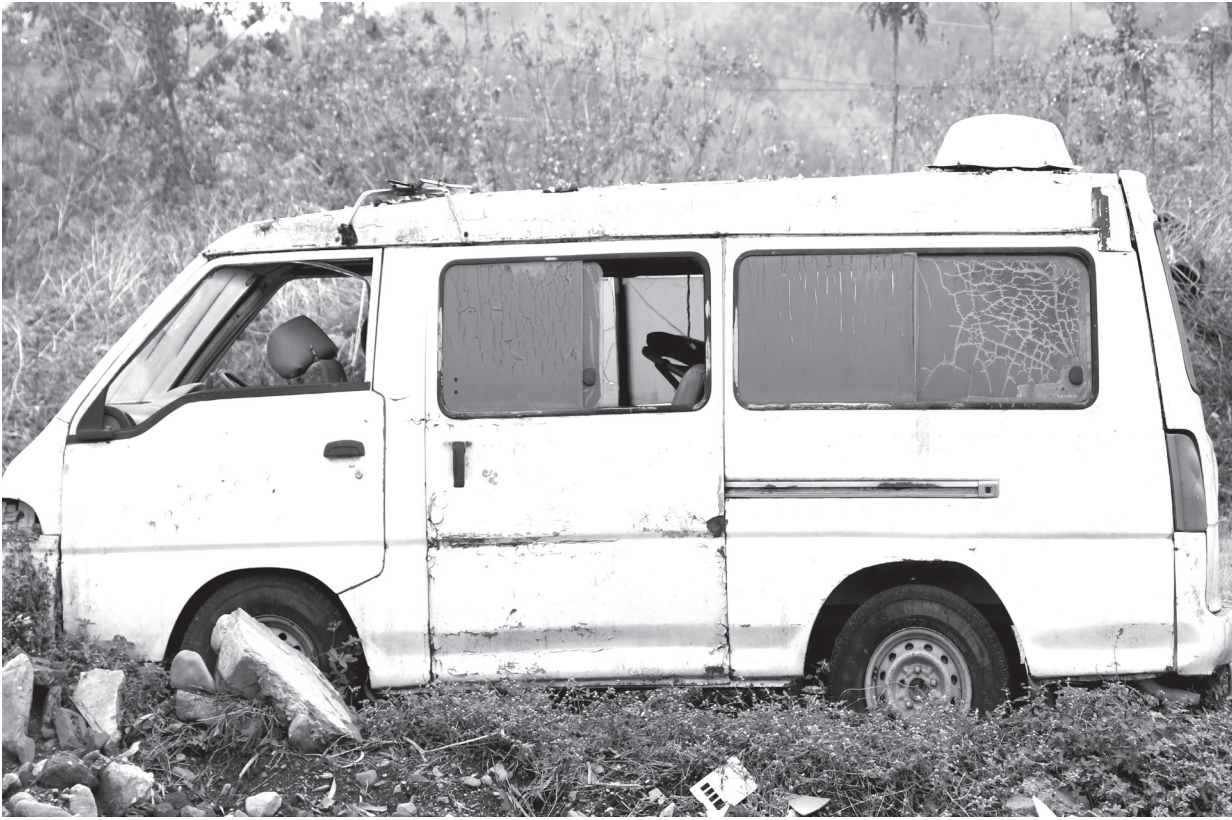
शक्तिएको एम्बुलेन्स : राप्ती स्वास्थ्य विज्ञान प्रतिष्ठान परिसरमा लामो समयदेखि जीर्ण अवस्थामा थन्किएको एम्बुलेन्स । प्रतिष्ठानसँग सञ्चालन योग्य आफ्नै एम्बुलेन्स नहुँदा विरामी ओसारपसारका लागि सर्वसाधारणले अन्य संस्थाका एम्बुलेन्स वा निजी सवारी साधन प्रयोग गर्न बाध्य छन् ।